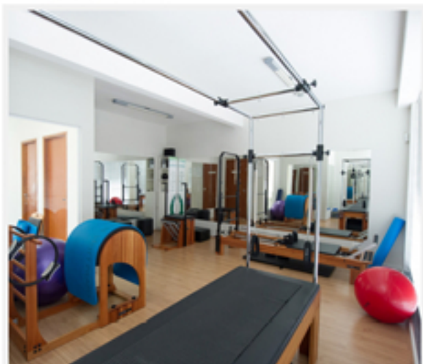
Academia Leven

Publicado em julho 26, 2012 por Mariana de Paula