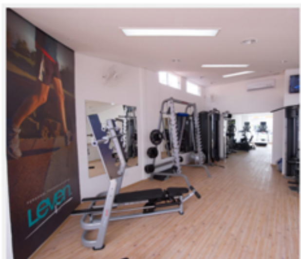
Academia Leven

Serviço: www.academialeven.com.br Leven Moema: Av. Moema, 787, Moema Leven Paraisópolis: Rua Tuboia, 777, Paraisópolis.